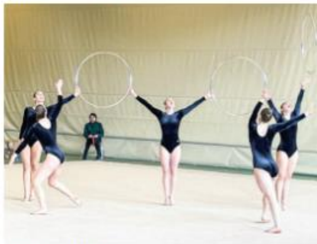
Gruppe G4 RG Ittigen