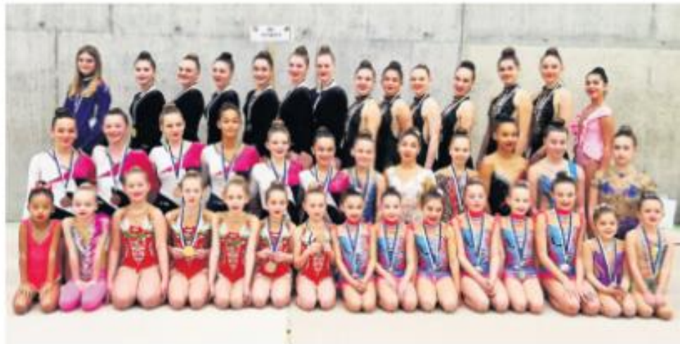
RG Ittigen Gymnastinnen

Alle Sportgenerationen haben am 29. April 2023 zusammengefunden - von den jüngsten «Schmetterlingen», die Medaillen trugen, bis hin zu den Trainerinnen, die gemeinsam mit den älteren Gymnastinnen in der Gruppe G4 eine hohe Beherrschung der Handgeräte und eine hervorragende Koordination zeigten. Der grossartige und herzerwärmende Abschluss eines grossartigen Jubiläumstages war die Finalshow.