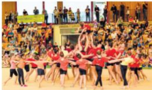
Finalshow Ittigger Cup 2023